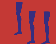
HENK VISCH (Eindhoven, 1958) Once Again, multiple, 2006 brons, unlimited edition, 110 cm hoog Fortis