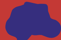
TONY CRAGG (Glasgow, 1949) Early Forms, oplage 3/3, 1993 brons, 75 x 100 x 130 cm Rabo Bouwfonds