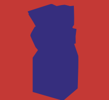
EWERDT HILGEMANN (Witten, 1938) Double implosion, 2005 roest vrij staal, 225 x 75 x 75 cm AEGON