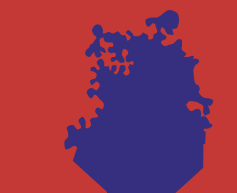
FRANK BRUGGEMAN (Noordoostpolder, 1966) Dutchscape/Nomad#1, 2007 bouwcontainers, 172 x 187 x 110 cm inheemse beplanting: Gelderseroos, Hazelaar, Krent Rabo Bouwfonds