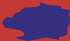
ROB VOERMAN (Deventer, 1966) Annex #4, 2006 auto, staal, hout, polycarbonaat, plexiglas, glas-in-lood, 500 x 235 x 270 cm ABN AMRO

TOEKOMST Het is de bedoeling dat de beeldenlijn een continu karakter krijgt. Iedere twee jaar zou dit initiatief een vervolg moeten krijgen, steeds met behulp van een externe curator en een nieuw thema. Zo begeleidt de kunst het volgroeien van de Zuidas.