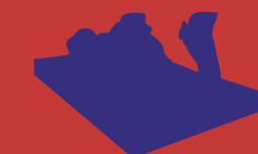
FERNANDO SÁNCHEZ CASTILLO (Madrid, 1970) Anamnesis, 2003 brons, 243 x 151 x 120 cm Rabobank