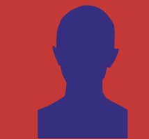
THOMAS RUFF (Zell am Harmersbach, 1958) Portraits: K. Eckert, 2001, ed. 1/4; S. Ergolovitch, 1998, ed. 2/4 F. Thiell, 1998, ed. 1/4; A. Zeitler, 1998, ed. 2/4 Chromogeen C-print met Diasec laag, houten lijst, 210 x 165 cm resp. ING, KPN